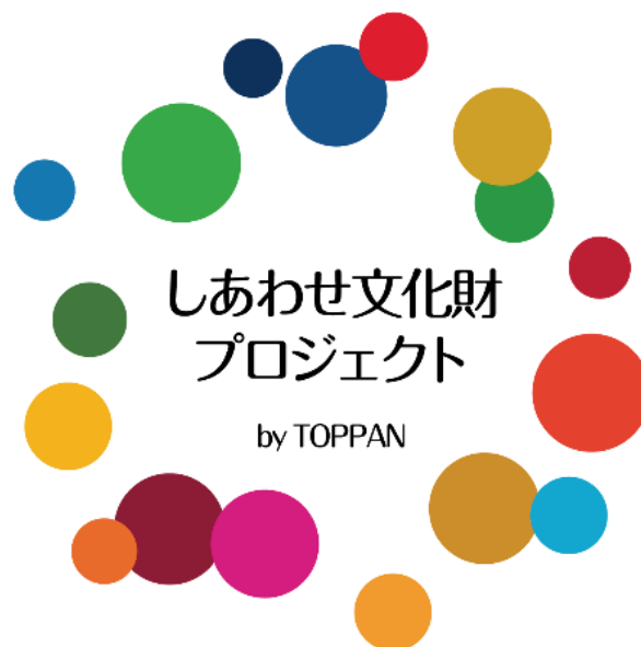
「しあわせ文化財プロジェクト」ロゴマーク

凸版印刷は本プロジェクトの活動を通じ、日本の文化財の魅力を国内外に発信するとともに、文化財の保存・活用支援を促進することで日本の観光立国の実現や地域活性化に貢献していきます。